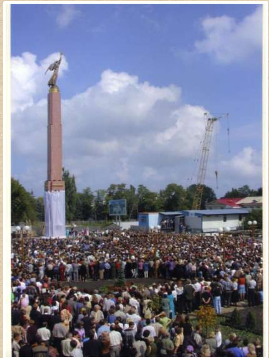
Строительство и открытие Монументальной композиции «Ангел-хранитель». 2002 год (фотодокументы, оп. № 1, ед. хр. 289, 290)