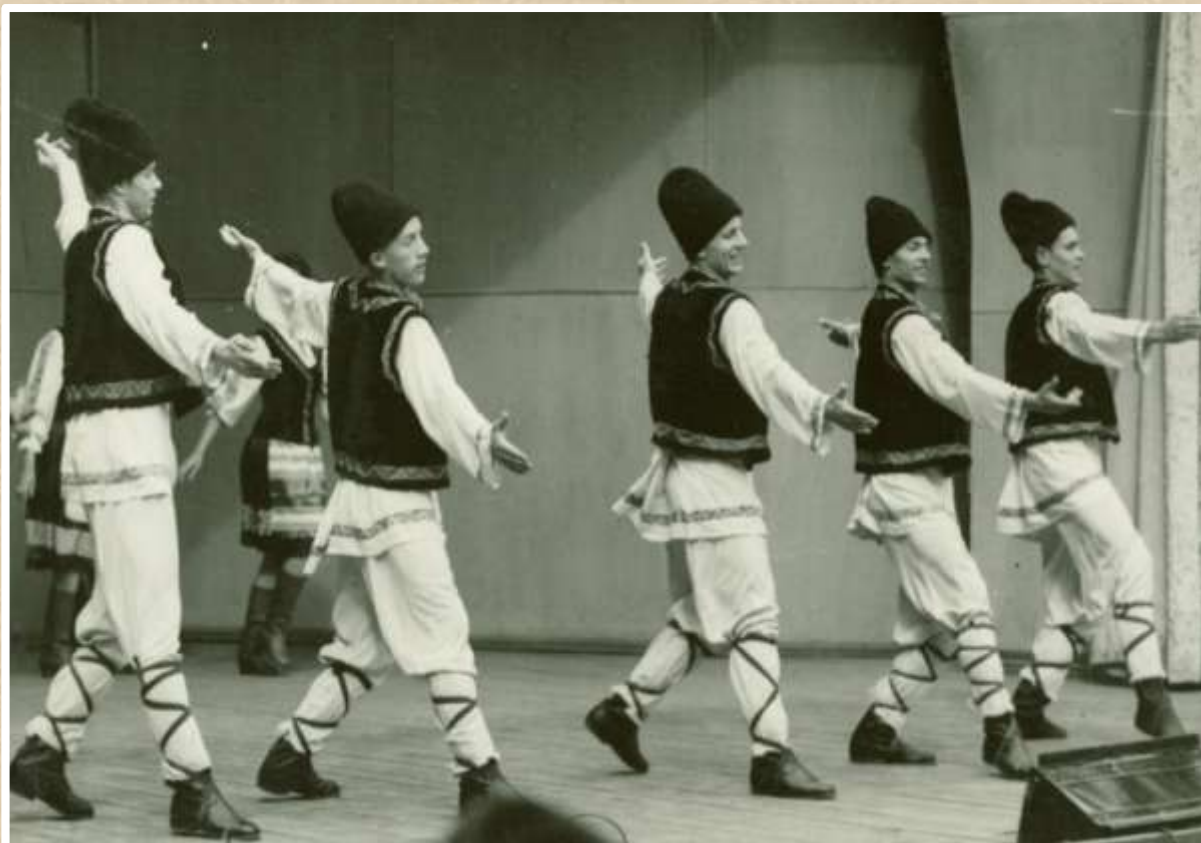
Праздник народного творчества. 1963 год (Ф. 70, оп. 1, д. 8 лл. 12-13)