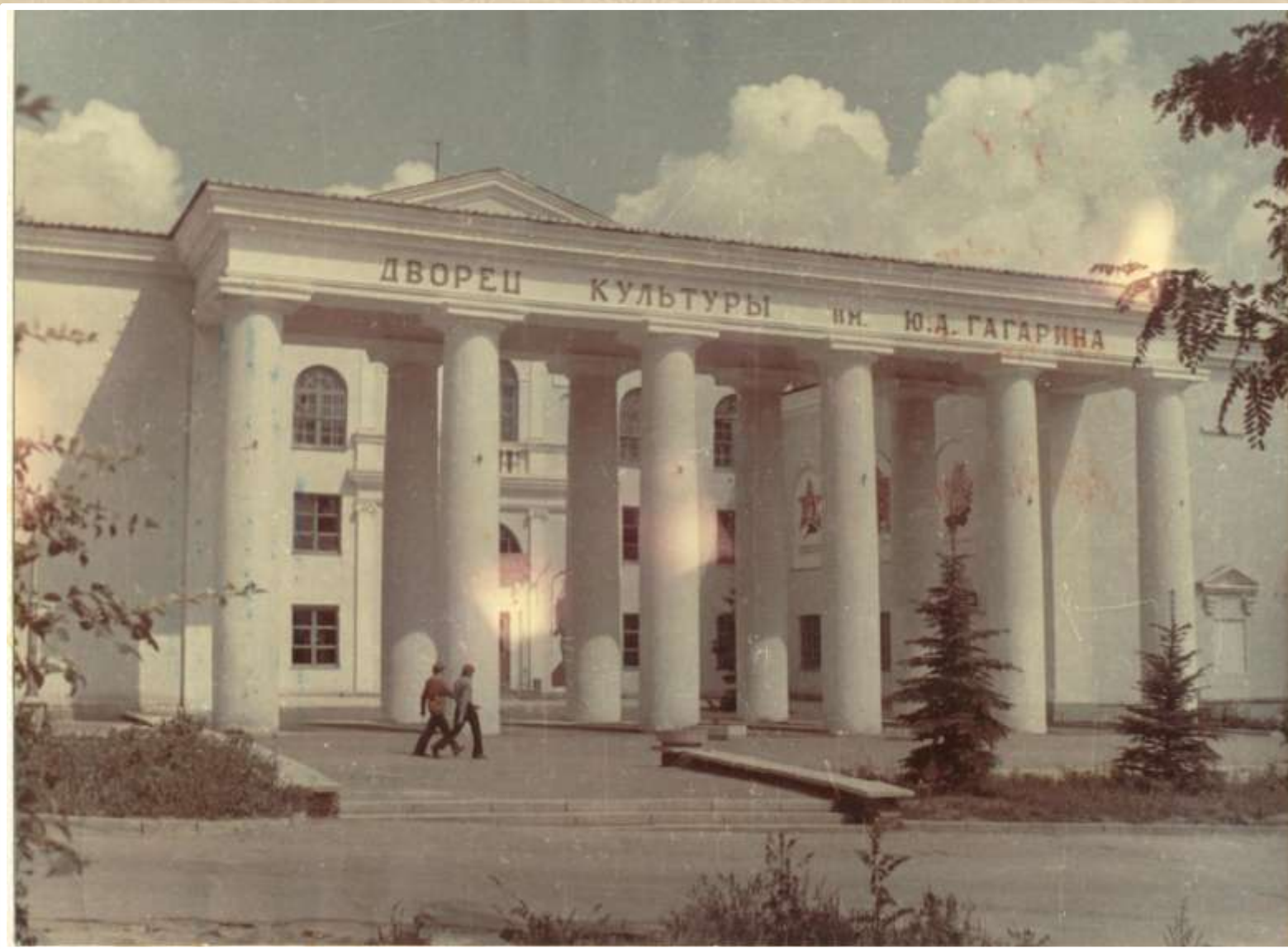
Ставропольский дворец культуры им. Ю.А. Гагарина. 1980 год (Ф. 70, оп. 1, д. 11 л. 1)