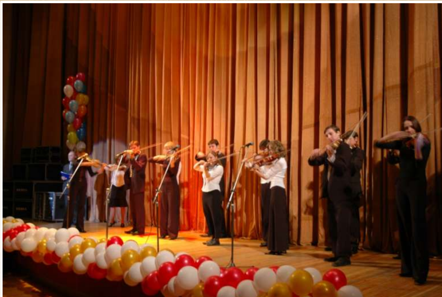
Выступление ансамбля струнных инструментов Ставропольского краевого училища искусств на праздновании Дня матери в Ставропольском академическом театре драмы им. М. Ю. Лермонтова. 2005 год