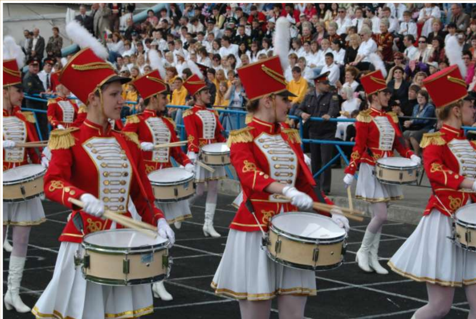
Празднование Дня Ставропольского края. Торжественное открытие праздника на стадионе «Динамо». 2006 год (фотодокументы, оп. № 1, ед. хр. 181)