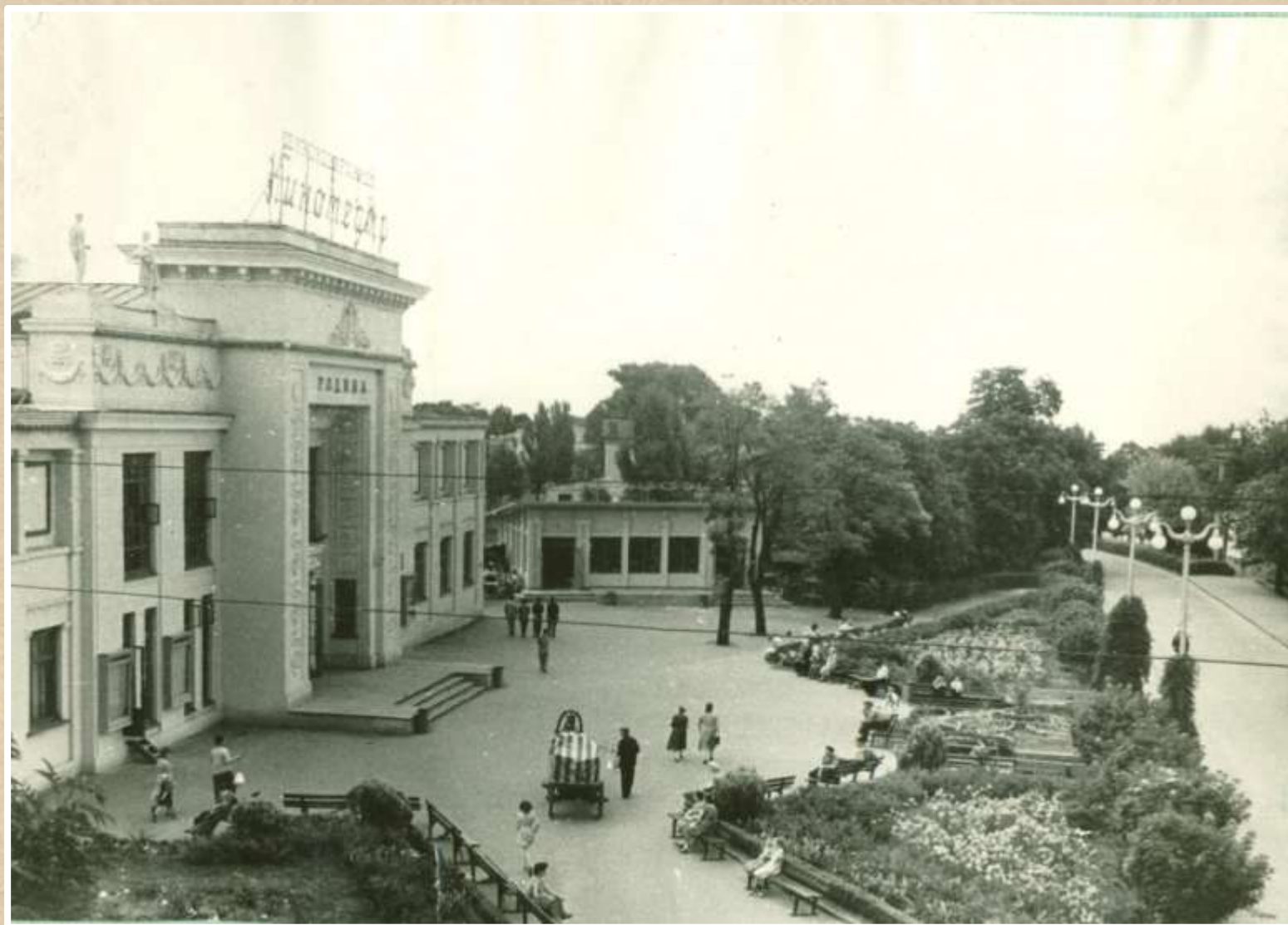
Кинотеатр «Родина». 1961 год (Ф. 70, оп. 1, д. 7 л. 7)