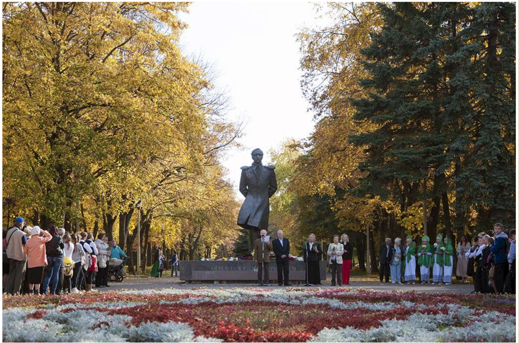
Городской литературный праздник, посвященный 200-летию со дня рождения М.Ю. Лермонтова. Праздничная программа в сквере у памятника великому поэту. 2014 год (фотодокументы, оп. № 1, ед. хр. 477)