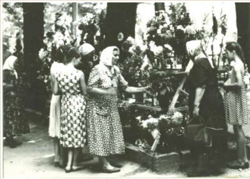
Выставка цветов в парке культуры и отдыха имени Ленинского комсомола. 1963 год (Ф. 70, оп. 1, д. 8 лл. 20-21)