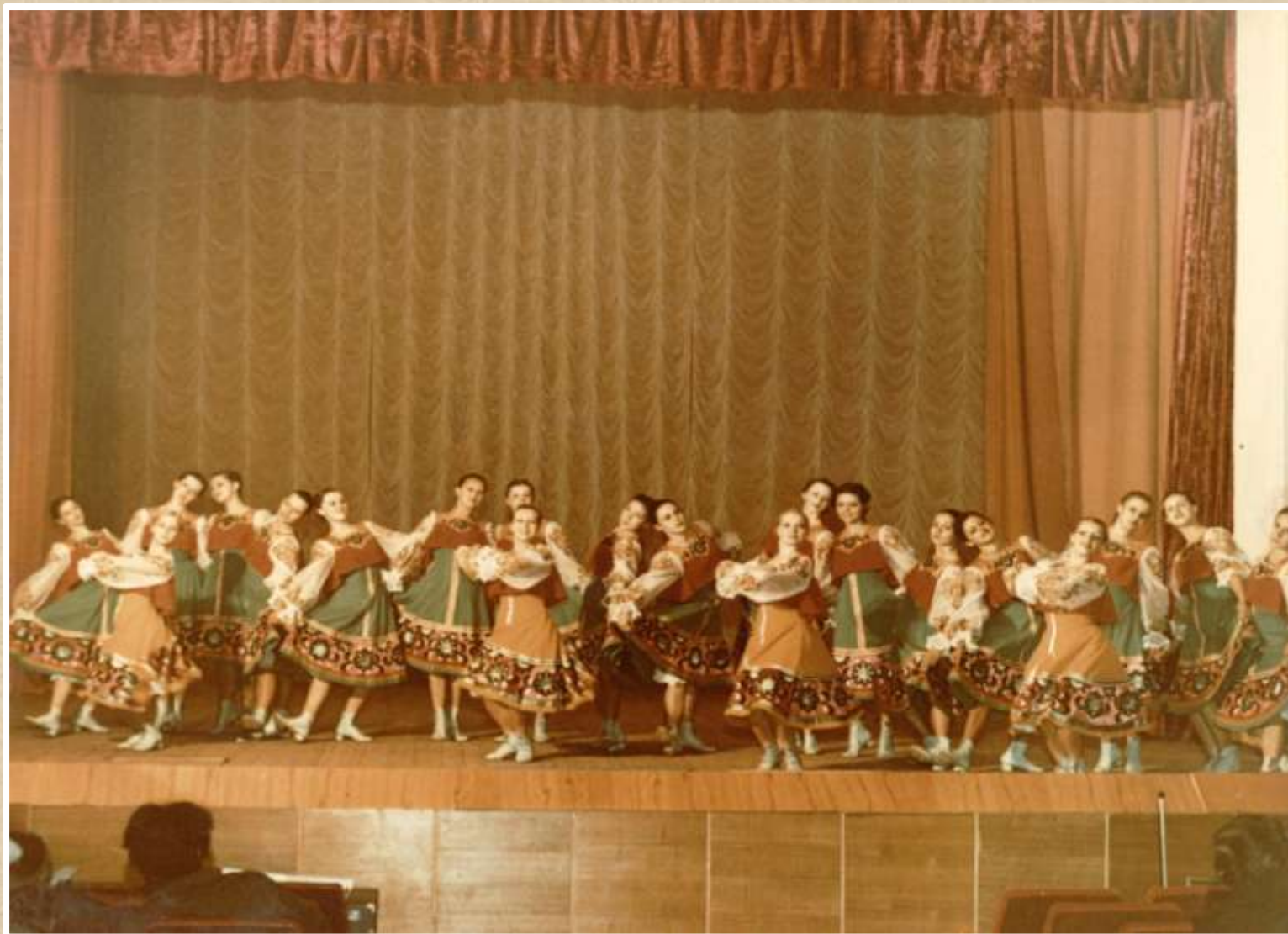
Выступление ансамбля «Заряночка» в Ставропольском дворце культуры им. Гагарина. 1978 год (Ф. 70, оп. 1, д. 10 л. 41)