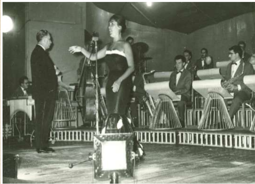
Выступление оркестра Олега Лундстрема в Зеленом театре парка культуры и отдыха им. Ленинского комсомола. 1963 год (Ф. 70, оп. 1, д. 8 л. 26)