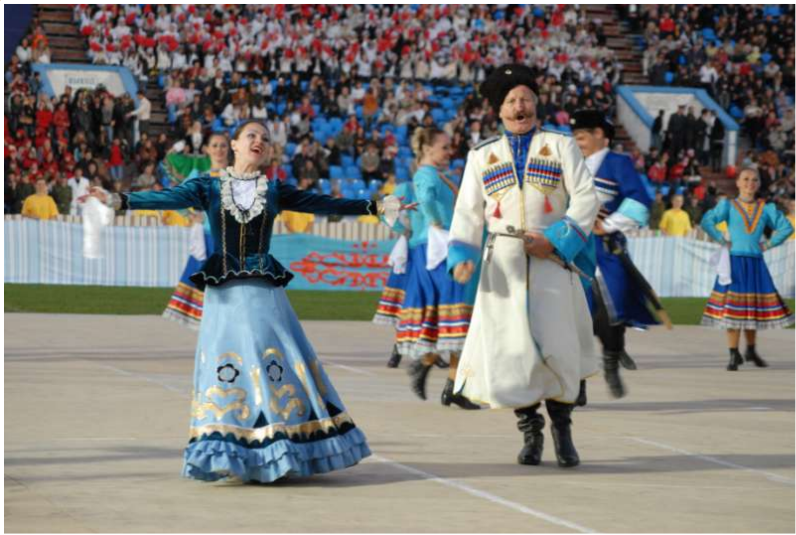
Заключительное театрализованное представление празднования 230-летия города «Ставрополь – город добра и справедливости». 2007 год (фотодокументы, оп. № 1, ед. хр. 252)