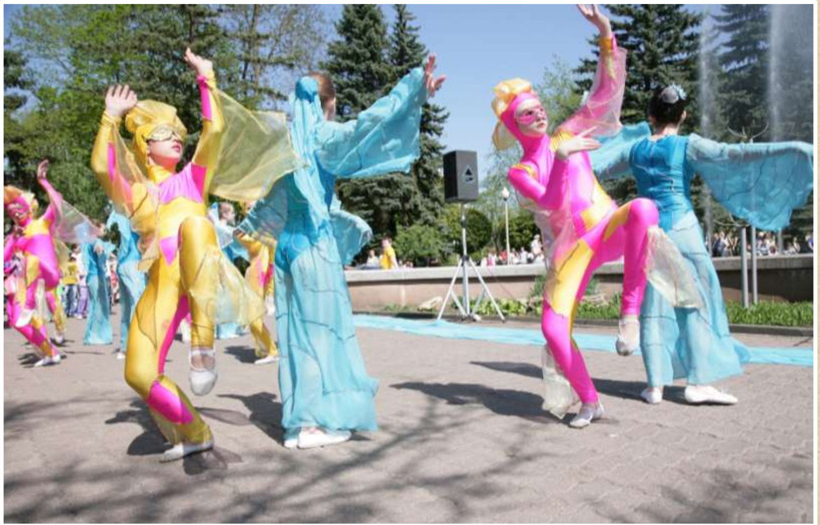
Праздник фонтанов. Выступление танцевального ансамбля «Jazz dance». 2013 год (фотодокументы, оп. № 1, ед. хр. 444)