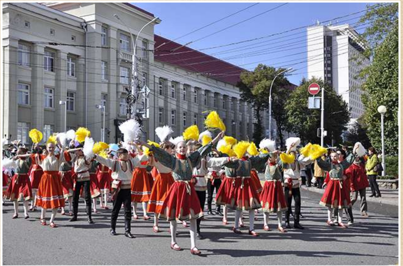
Театрализованное шествие во время празднования Дня города Ставрополя. 2014 год (фотодокументы, оп. № 1, ед. хр. 470)